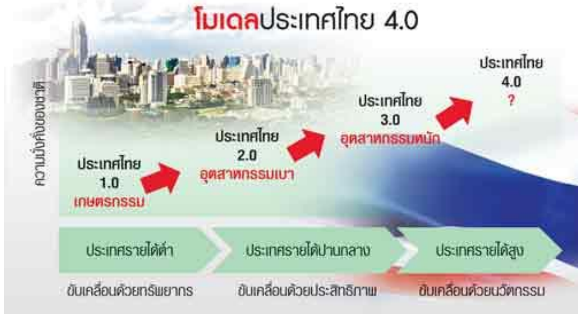
รูปภาพที่ ๗ โมเดลประเทศไทย ๔.๐

กลุ่มที่ ๑ การยกระดับนวัตกรรมและผลิตภัณฑ์การปรับแก้กฎหมายและกลไกภาครัฐ พัฒนาคัลส์เตอร์ภาคอุตสาหกรรมแห่งอนาคต และการดึงดูดการลงทุน และการพัฒนาโครงสร้างพื้นฐาน กลุ่มที่ ๒ การพัฒนาการเกษตรสมัยใหม่และการพัฒนาเศรษฐกิจฐานรากและประชารัฐ กลุ่มที่ ๓ การส่งเสริมการท่องเที่ยวและไมล์ การสร้างรายได้ และการกระตุ้นการใช้จ่ายภาครัฐ กลุ่มที่ ๔ การศึกษาพื้นฐานและพัฒนาผู้นำ (โรงเรียนประชารัฐ) รวมทั้งการยกระดับคุณภาพวิชาชีพ กลุ่มที่ ๕ การส่งเสริมการส่งออกและการลงทุนในต่างประเทศ รวมทั้งการส่งเสริมกลุ่ม SMEs และผู้ประกอบการใหม่ (Start Up) ซึ่งแต่ละกลุ่มกำลังวางระบบและกำหนดแนวทางในการขับเคลื่อนนโยบายอย่างเข้มข้น