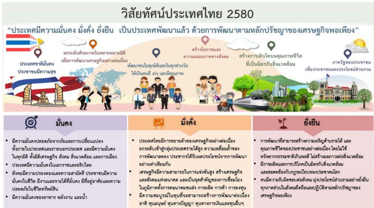
รูปภาพที่ ๔ แสดงการพัฒนายุทธศาสตร์ชาติ ๒๐ ปี