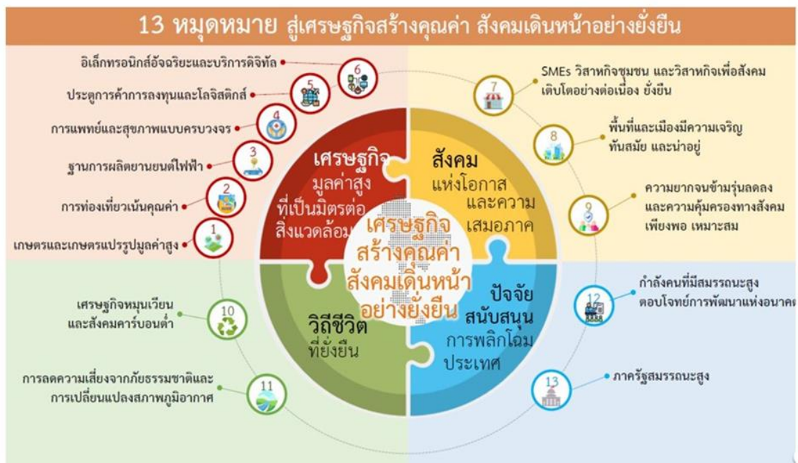
รูปภาพที่ ๕ กรอบแผนพัฒนาเศรษฐกิจและสังคมแห่งชาติ ฉบับที่ ๑๓

เพื่อถ่ายทอดเป้าหมายหลักไปสู่ภาพของการขับเคลื่อนที่ชัดเจนในลักษณะของวาระการพัฒนา (Agenda) ที่เอื้อให้เกิดการทำงานร่วมกันของหลายหน่วยงานและหลายภาคส่วนในการผลักดันการพัฒนาในเรื่องใดเรื่องหนึ่งให้เกิดผลได้อย่างเป็นรูปธรรม แผนพัฒนาเศรษฐกิจและสังคมแห่งชาติ ฉบับที่ ๑๓ จึงได้กำหนดหมุดหมายการพัฒนา จำนวน ๑๓ ประการ ซึ่งเป็นการบ่งบอกถึงสิ่งที่ประเทศไทยปรารถนาจะ ‘เป็น’ มุ่งหวังจะ ‘มี’ หรือต้องการจะ ‘ขจัด’ เพื่อสะท้อนประเด็นการพัฒนาที่มีลำดับความสำคัญสูงต่อการพลิกโฉมประเทศไทยสู่ “สังคมก้าวหน้า เศรษฐกิจสร้างมูลค่าอย่างยั่งยืน” และการบรรลุเป้าหมายหลักในช่วงระยะเวลา ๕ ปี ของแผนพัฒนาเศรษฐกิจและสังคมแห่งชาติ ฉบับที่ ๑๓ โดยหมุดหมายการพัฒนาทั้ง ๑๓ ประการมีที่มาจาก การประเมินโอกาสและความเสี่ยงของไทยในการพัฒนา ประเทศภายใต้กรอบของยุทธศาสตร์ชาติ ซึ่งได้มีการพิจารณาถึงแนวโน้มการเปลี่ยนแปลงระดับโลก สถานการณ์การแพร่ระบาดของโรคโควิด-๑๙ รวมถึงผลการพัฒนาในประเทศไทยในระยะเวลาที่ผ่านมา ทั้งนี้ หมุดหมายการพัฒนาที่กำหนดขึ้นเป็นประเด็นที่มีลักษณะเชิงบูรณาการ ซึ่งสามารถนำไปสู่การพัฒนาทั้งในด้านเศรษฐกิจ สังคม ทรัพยากรธรรมชาติและสิ่งแวดล้อมไปพร้อม ๆ กัน ทำให้หมุดหมายแต่ละ ประการสามารถสนับสนุนเป้าหมายหลักได้มากกว่าหนึ่งข้อ โดยหมุดหมายทั้ง ๑๓ ประการ แบ่งออกได้เป็น ๔ มิติ ดังนี้