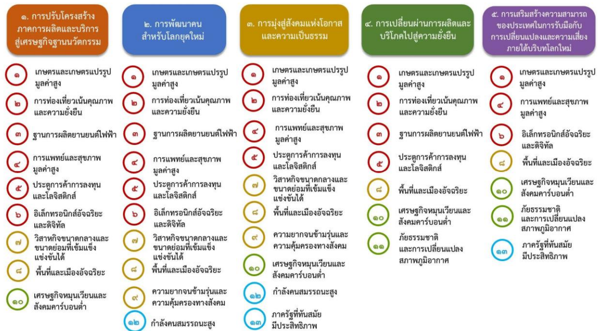
รูปภาพที่ ๖ ความเชื่อมโยงระหว่างหมวดหมู่การพัฒนา กับเป้าหมายหลัก

หมวดหมู่ที่ ๑๓ ไทยมีภาครัฐที่ทันสมัย มีประสิทธิภาพ และตอบโจทย์ประชาชน โดยยกระดับภาครัฐให้มีความสมรรถนะสูงและคล่องตัว สามารถก้าวสู่การเป็นภาครัฐดิจิทัลอย่างเต็มรูปแบบ รวมถึงการยกเลิกกฎหมายที่ไม่จำเป็นและเป็นอุปสรรคต่อการพัฒนาประเทศ